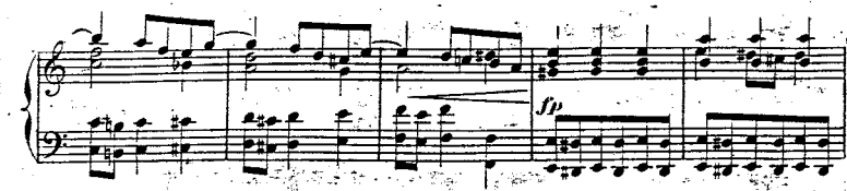
Exemple 7 : Minuetto alla tedesca op. 45

Dans le Minuetto alla tedesca op. 46, une pièce portant parmi tant d'autres un titre de danse baroque ou classique, une autre de ses méthodes préférées apparaît : un ostinato de pédale (à la basse ici, mais le plus souvent aux autres voix), dont la fonction est d'étendre ou de retarder la transition à la section suivante, par le truchement de figurations tout à fait conventionnelles qui conduisent à de radicales combinaisons harmoniques :