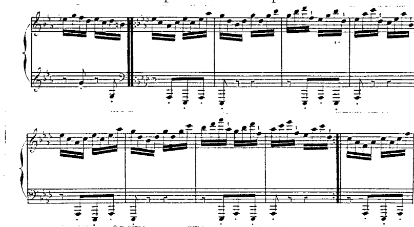
Exemple 4 : Toccatina op. 75

Dans leurs meilleurs moments, les exceptionnels effets d'orchestration d'Alkan, suggèrent Mahler bien plus que Liszt par exemple, dans la mesure où l'écriture est subtile et de caractère soliste au lieu de recourir aux effets de masses. L'évocation de tambours, timbales, cuivres en solo et bois, voire même de voix ( La Voix de l'instrument op. 70 n°4) paraissent accentuer la tendance à l'isolement et à la tragédie personnelle du compositeur.