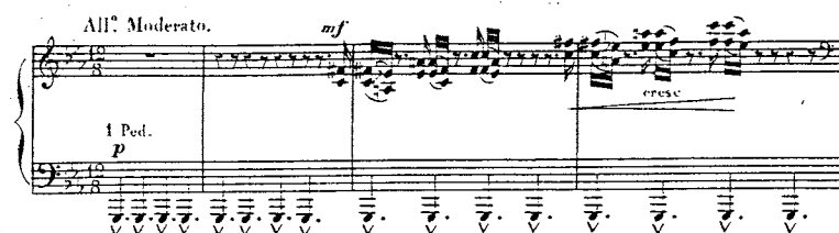
Exemple 5 : L'Incendie au village voisin op. 35 n°7

Mais bien sûr, à part certains détails, Alkan écrit simplement des choses que la plupart des romantiques n'auraient pas osées, et qui ne trouveront leur expression courante en musique qu'à l'époque de Bartók :