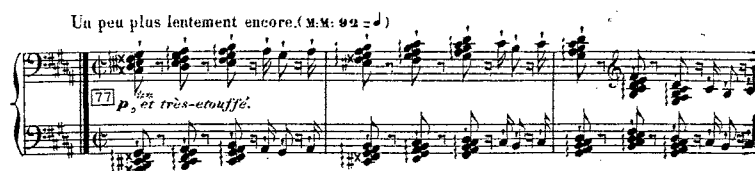
Exemple 6 : Les Diablotins op. 63 n°45

On pourrait objecter que dans ces exemples, les clusters ne sont pas utilisés dans le but moderne d'obtenir un bruit blanc, qu'ils sont plutôt incorporés à l'harmonie et aux usages mélodiques traditionnels, et n'ont donc qu'un but de coloration, comme l'aurait une guirlande de petites notes : j'estime néanmoins confondant qu'ils aient été écrits ainsi, quelle que soit la justification qu'on leur trouve *.